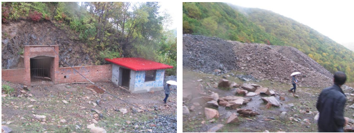
照片 4-1 PD1 工业场地及废石场