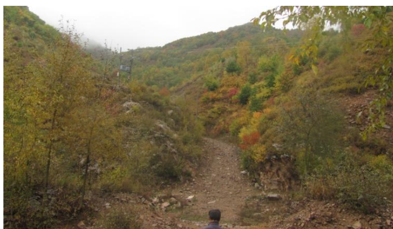
照片 4-4 矿区道路

根据土地利用现状图，现状破坏的土地类型为旱地、有林地、灌木林地、其他草地及村庄，其中旱地面积 508m 2 ，有林地面积 2088m 2 ，灌木林地面积 224m 2 ，其他草地面积 1988m 2 ，村庄面积 112m 2 。