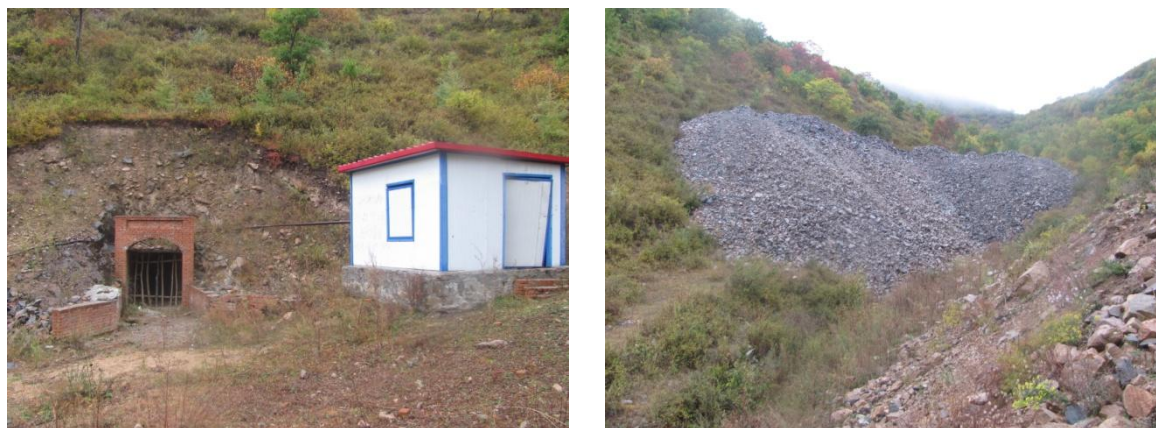
照片 4-2 PD2 工业场地及废石场

根据土地利用现状图，现状破坏的土地类型为灌木林地、其他草地，其中灌木林地 60m 2 ，其他草地 1490m 2 。