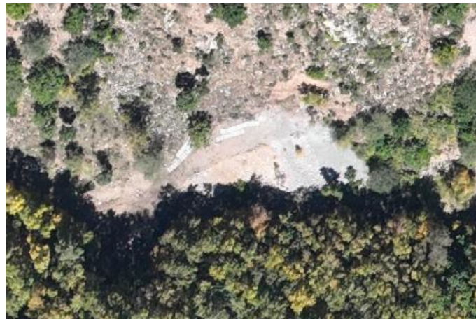
照片 4-5 PD5 工业场地及废石堆

根据土地利用现状图，现状破坏的土地类型为其他草地，面积为 715\text{m}^2 。