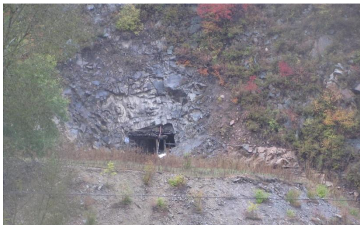
照片 4-3 PD3 工业场地

根据土地利用现状图，现状破坏的土地类型为其他草地；其面积为 900\text{m}^2 。