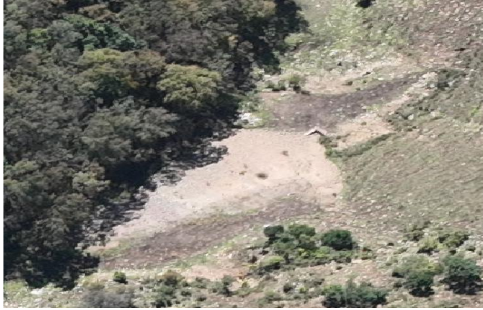
照片 4-4 PD4 工业场地及废石堆