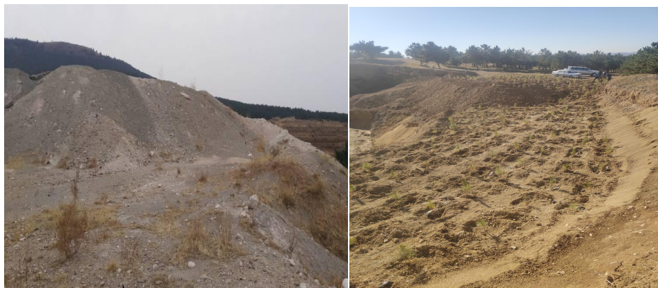
排土场，恢复植被照片

排土场损毁土地面积 2170m 2 ，损毁土地类型均为有林地，现已回复植被经过林业局验收。