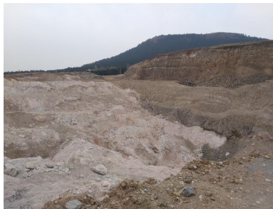
照片 4-1 露天采坑