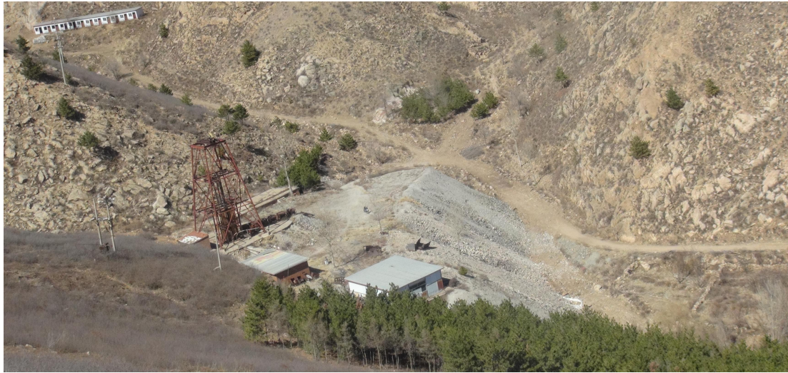
照片 4-8 SJ2 工业场地、SJ2 废石场、水井房、办公生活区相对位置