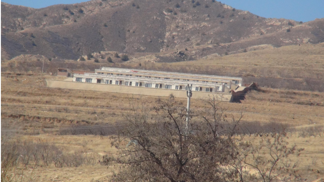
照片 4-11 办公生活区

办公生活区位于矿区东 1270m 处（见照片 4-11），压占土地面积 7000m 2 ，主要由办公室、休息室、活动室、洗浴室、餐厅等组成。建筑物为砖瓦结构平房四排，每排建筑物长 50m、宽 7m、高 3m，场地周围采用砖砌围墙围封。旱厕位于场地西南侧。现状条件下，办公生活区地质灾害不发育。