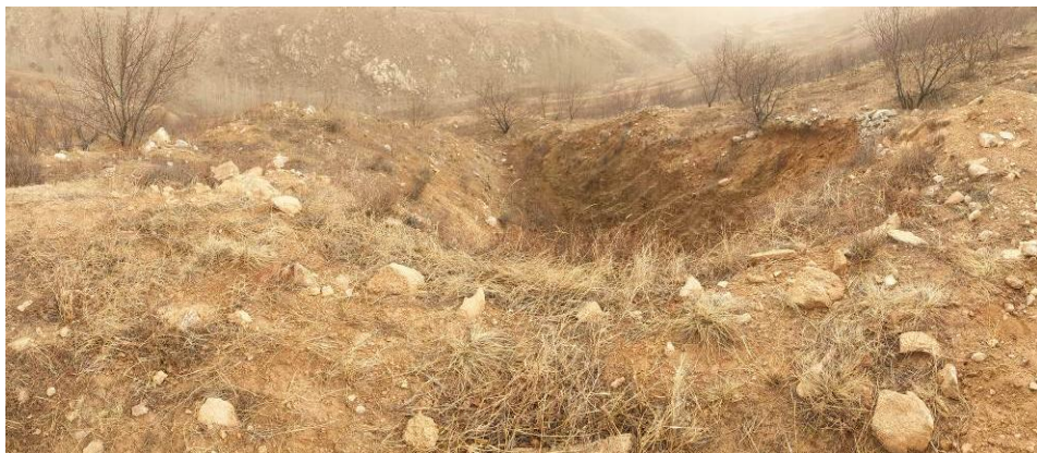
照片 4-13 探槽

探槽位于矿区东南侧约 300m，矿区道路至 SJ1 区域和 SJ2 区域岔路口东约 30m 处（见照片 4-13），场地呈矩形，长 19m，宽约 5m，损毁土地面积为 83m 2 。探槽平均挖深约 1.5m，挖方量 125m 3 。现状条件下，探槽地质灾害不发育。