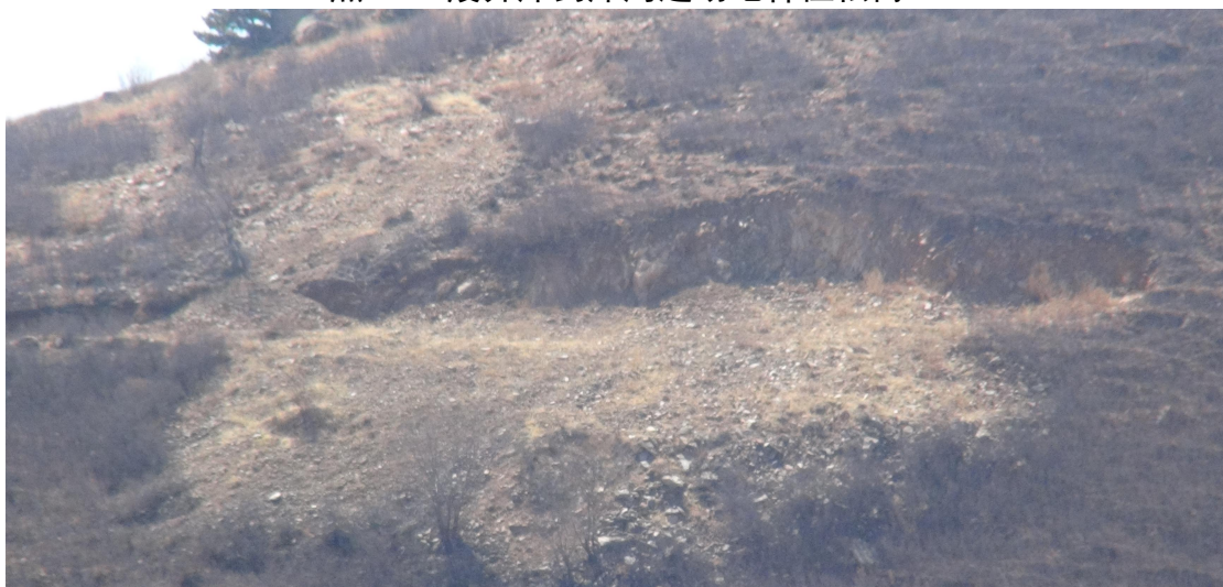
照2-3 2023年度探坑、探槽治理效果照片