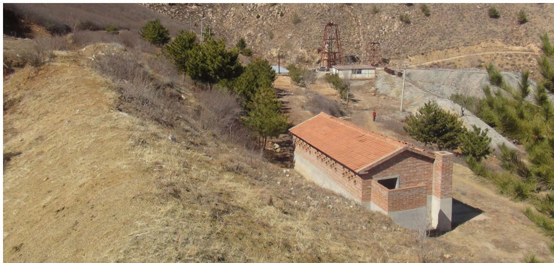
照片 4-7 旱厕

旱厕位于 SJ1 工业场地南 50m 处（见照片 4-7），损毁土地面积 600m 2 ，建筑物长 30m，宽 20m，高 3m，下部化粪池深 3m。现状条件下，旱厕地质灾害不发育。