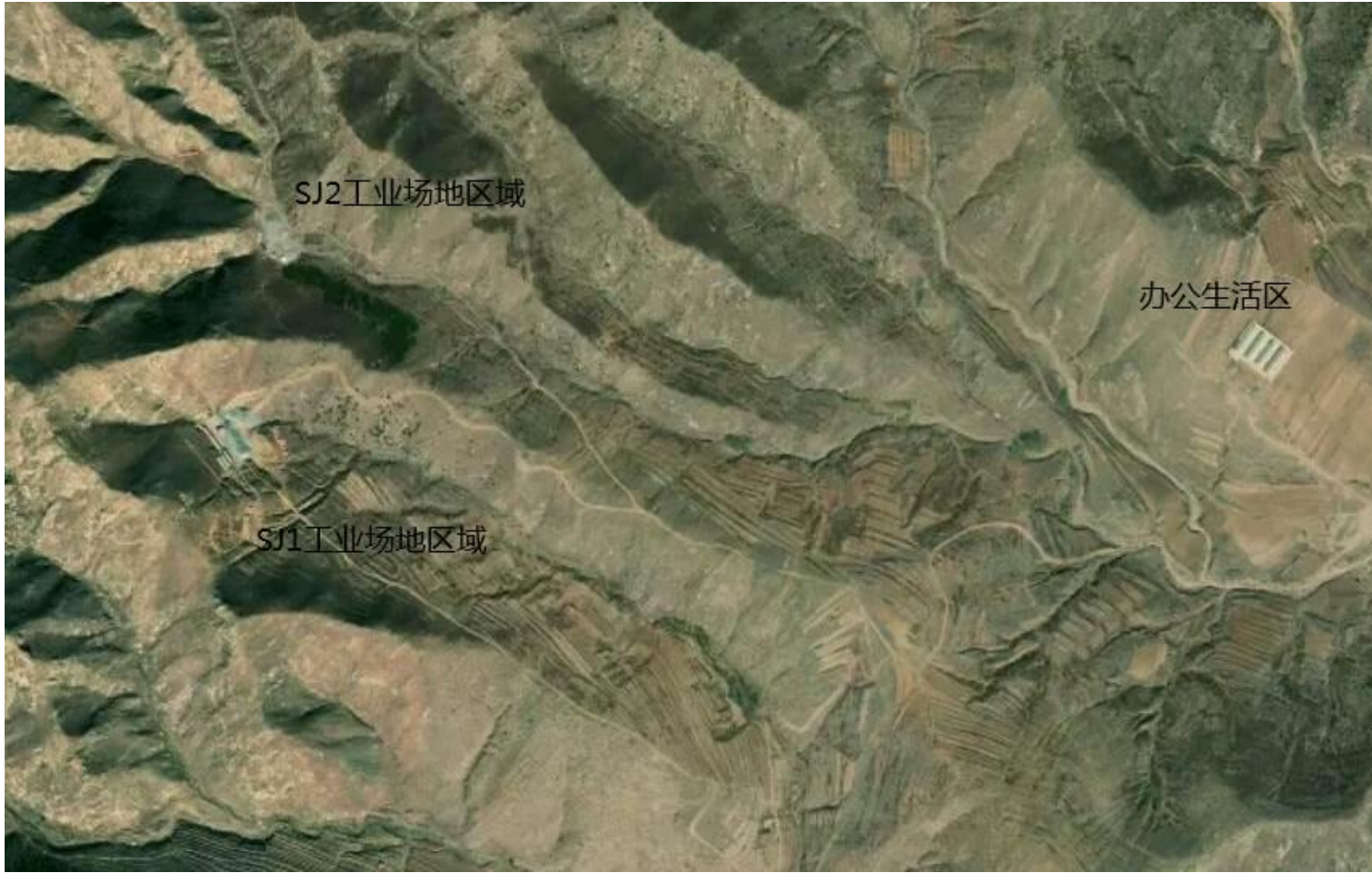
图4-1 矿区现状工程单元卫片分布图