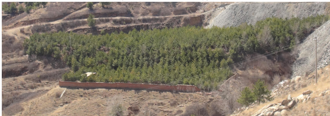
照2-2 废弃炸药库周边场地种植松树