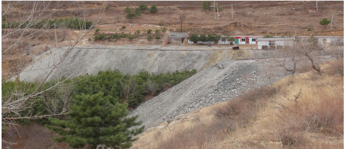
照片4-3 SJ1废石场、SJ1矿石场