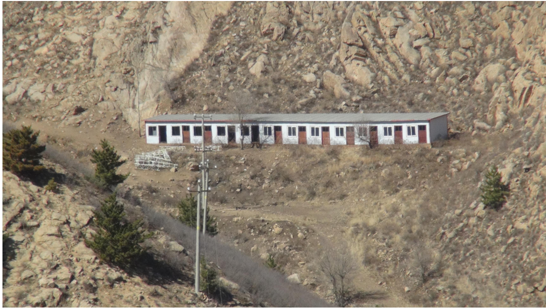
照片 4-10 SJ2 办公生活区