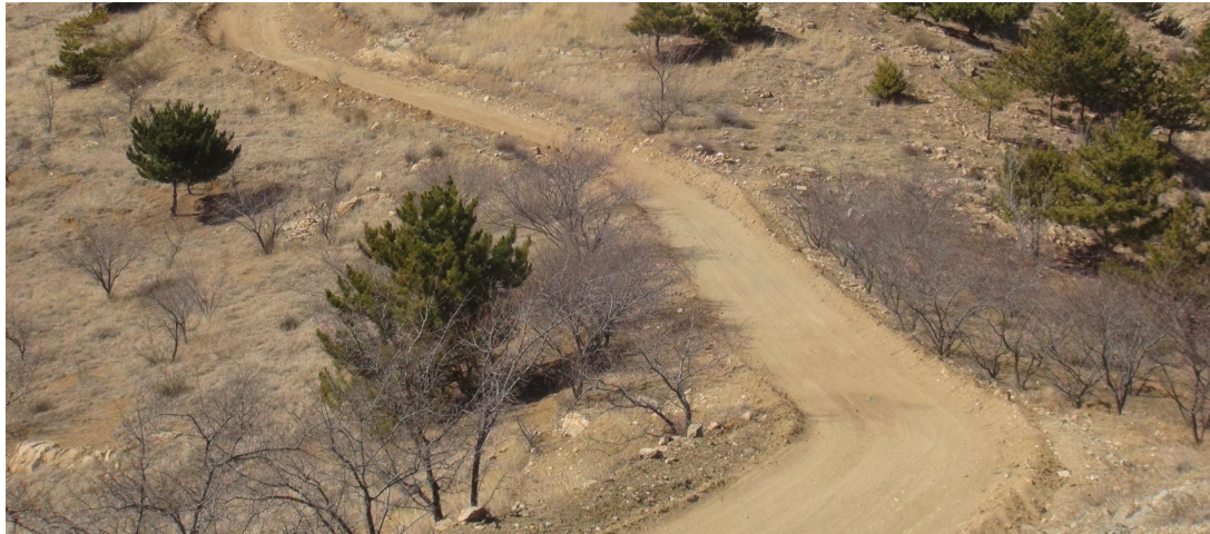
照片 4-12 矿区道路