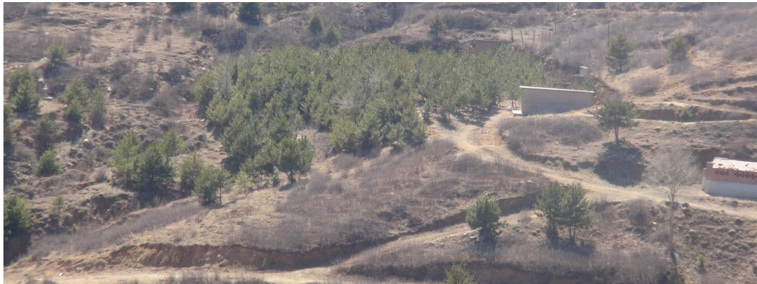
照片 4-6 炸药库

炸药库位于 SJ1 工业场地南 150m 处，损毁土地面积 1195m 2 ，主要有值班室、炸药库、雷管库组成（见照片 4-6）。值班室规格为长 8m，宽 6m，高 3m；值班室西侧为一岩质切坡，切坡坡面角 70°，高度为 3m，岩性为花岗片麻岩，坡体稳定，炸药库位于值班室南侧 20m 处岩质切坡处掘进形成的，规格为长 6m、宽 4m、高 3.3m，顶部混凝土浇筑；雷管库位于炸药库南 30m 处，同样在岩质切坡处掘进形成的，规格为长 8m、宽 6m、高 3.3m，顶部混凝土浇筑；现状条件下，炸药库地质灾害不发育。