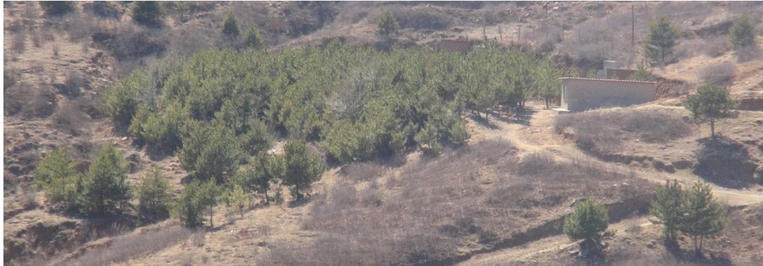
照2-1 新建炸药库周边场地种植松树

树 1000m 2 ，完成废弃炸药库和新建炸药库周围种植松树面积 8380m 2 ，完成矿山地质环境治理总面积 11614.4m 2 （治理后效果见照片 2-1 至 2-2），远超过首期实施方案设计的治理面积 4200m 2 ，首期治理工程通过验收（验收编号：16248），治理资金投入 15 万元。