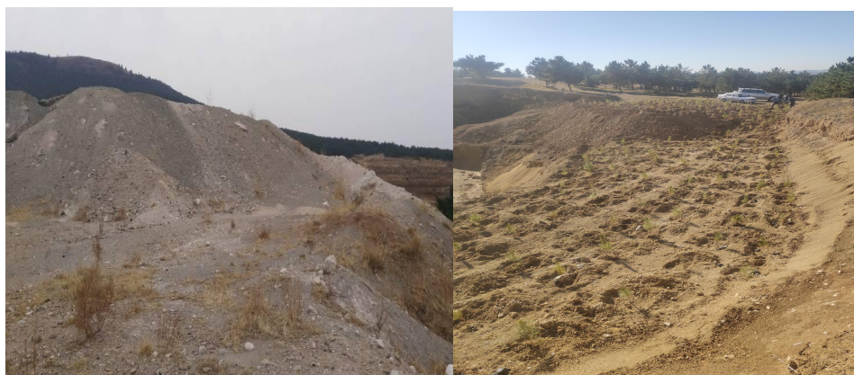
排土场，恢复植被照片

排土场损毁土地面积 2170m 2 ，损毁土地类型均为有林地，现已回复植被经过林业局验收。