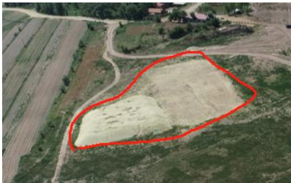
照片 4-8 3#临时堆料场远景

3#临时堆料场位于1#露天采场东侧，占地面积约4233m 2 。为临时堆放场所，堆积高度1-3m，堆积坡度约25°，堆积方量2980m 3 。场地的建设破坏了地形地貌景观和植被（见照片4-8）。