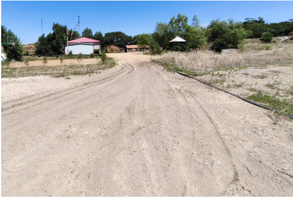
照片 4-10 矿区道路