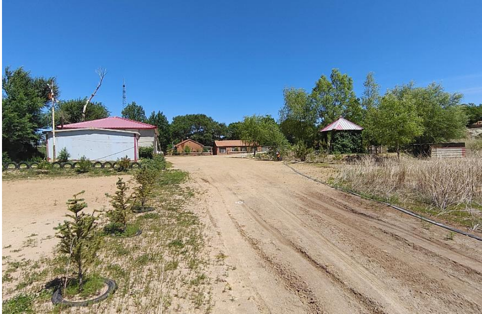
照片4-9 办公生活区近景

办公生活区位于二采区中部，占地面积为4313m 2 。建筑为砖混结构，建筑面积788m 3 ，建筑物高约3m。办公生活区周边已进行绿化，已建设简易篮球场、菜园、凉亭、鱼塘等。场地建设破坏了地形地貌景观（见照片4-9）。