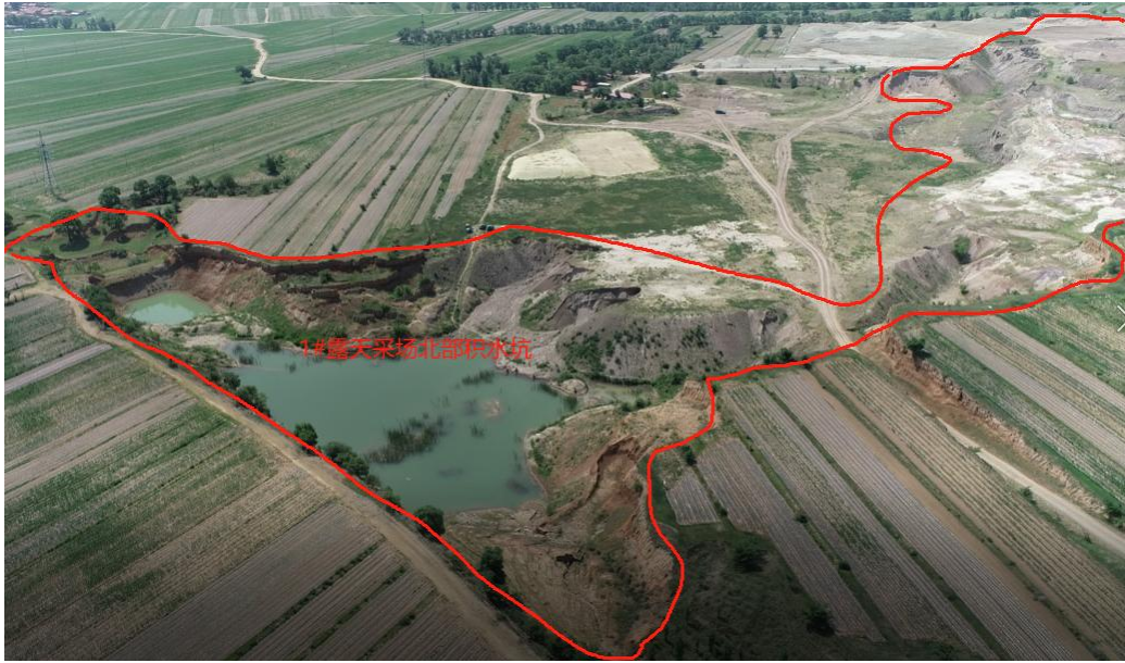
照片4-1 1#露天采场远景