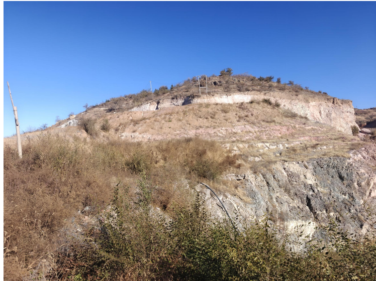
照片4-2 选矿场治理效果