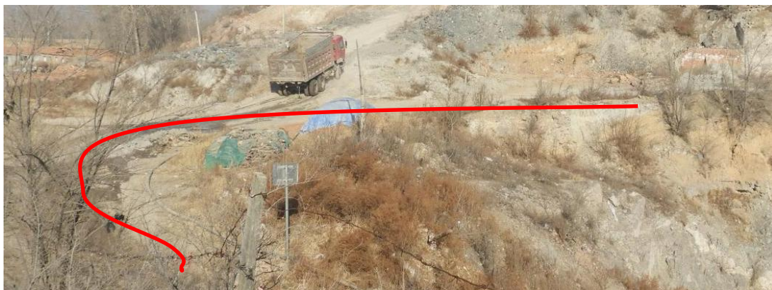
照片 3-6 矿区道路

矿区道路占地面积为 540m 2 ，损毁土地类型为灌木林地、采矿用地，对土地资源的影响程度属轻度。