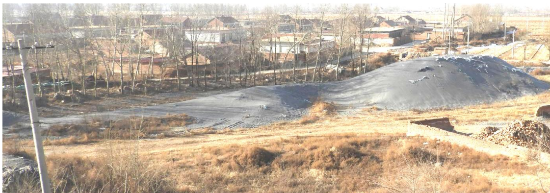
照片 3-3 矿石堆放场

场地面积为 2672m 2 ，损毁土地类型为乔木林地、采矿用地。对土地资源的影响程度属中度。