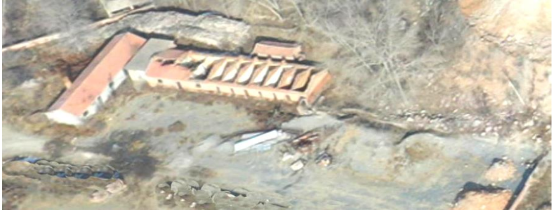
照片 3-4 办公生活区