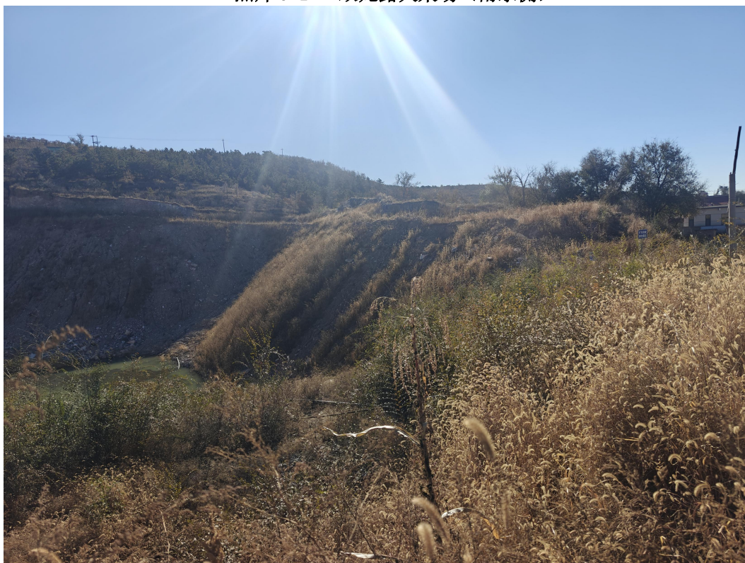
照片 3-2 双龙露天采场（南侧）