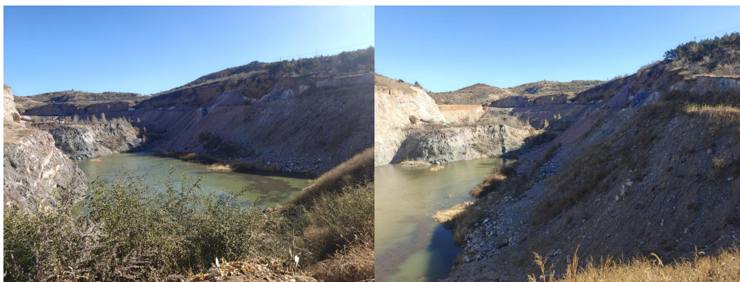
照片 3-1 双龙露天采场（南东侧）