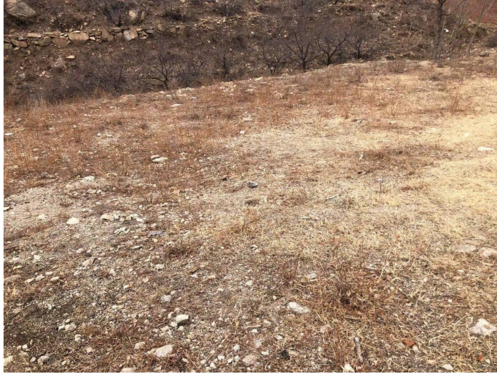
照片 2-3 休息室治理效果