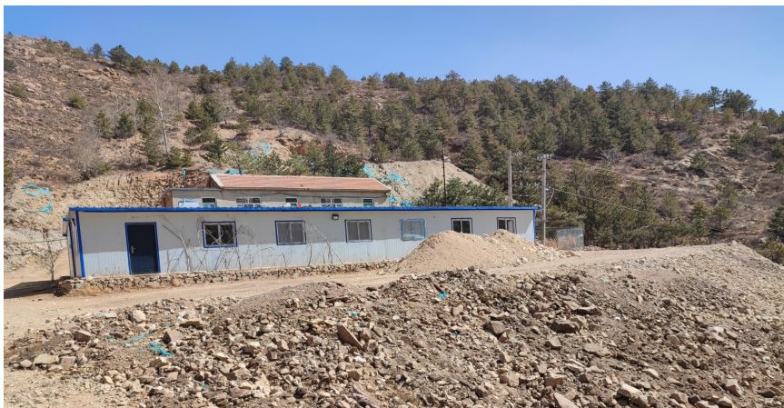
照片 4-1 1 号工业场地

1 号工业场地位于矿区内西侧，场地面积 149m 2 ，场地内设有平硐、井口房、办公生活区等，PD1 在场地北侧，平硐净断面 2.2×2m，平硐长约 110m，硐口标高 920m，平硐靠近山体的一侧形成了切坡，切坡高 1-5m，坡角约 60°，切坡长 16m；房屋靠近山体的一侧形成了高 1m，坡角约 60°，坡长 15m 的切坡。场地房屋平场时形成一处堆坡，堆坡坡角约 30°，坡长 20m。场地的建设，破坏了原生地形地貌景观，现状评估影响了地形地貌景观，（见照片 4-1）。