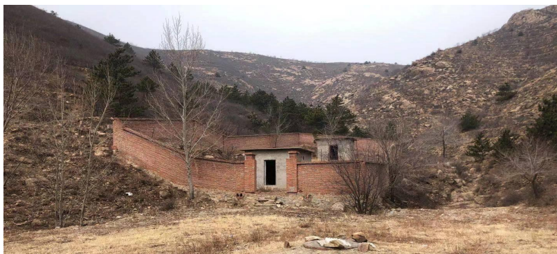
照片 4-4 炸药库

炸药库占地面积 557m 2 ，损毁土地类型为灌木林地和其他草地，其中其他草地面积为 46m 2 ，灌木林地面积为 511m 2 。