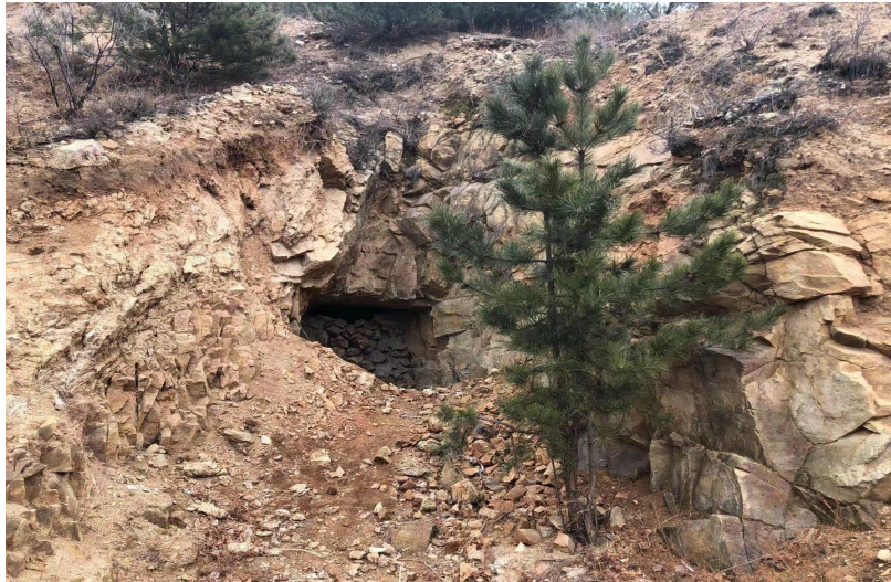
照片 4-2 二号工业场地

2号工业场地由平硐组成，是通风平硐，占地面积 21m 2 ，平硐（PD2）净断面 2.2×2m，平硐长约 60m，平硐硐口靠近山体的一侧形成了切坡，切坡高 1-2m，坡角约 60°，切坡长 8m，场地的建设，破坏了原生地形地貌景观，现状评估影响了地形地貌景观（见照片 4-2）。