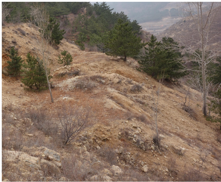
照片 2-2 2 号废石场治理效果