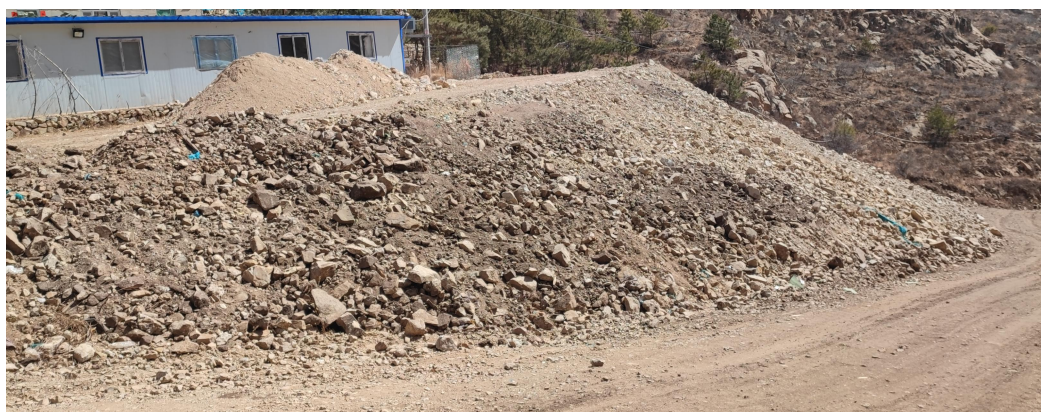
照片 4-3 1号废石堆

1号废石场占地面积1113m 2 ，损毁土地类型为其他草地、农村道路和设施农用地，其中其他草地面积为877m 2 ，农村道路面积为151m 2 ，设施农用地面积为85m 2 。