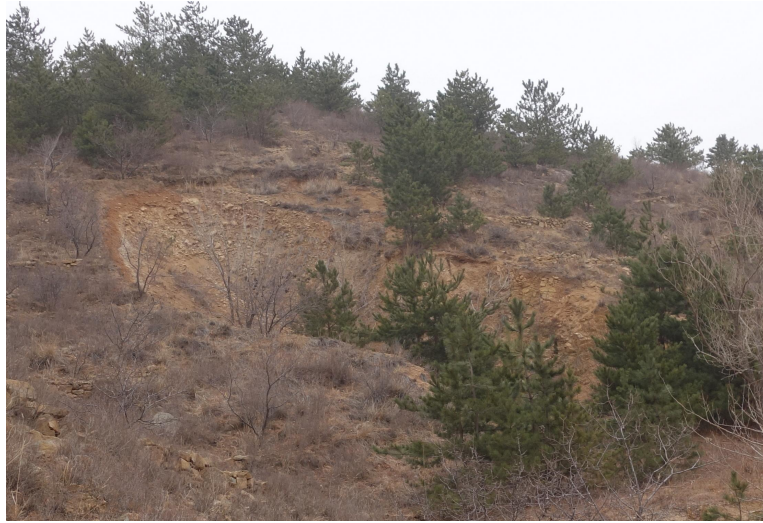
照片 2-1 露天采坑治理效果

根据《内蒙古自治区矿山地质环境分期治理工程验收意见书》(编号 16247), 2016 年 12 月 3 日, 专家组对矿山地质环境分期治理工程进行了现场验收。