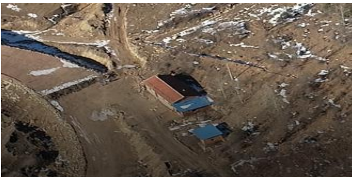
照片 2-8 2#值班室

位于矿区外北西部山坡底部，建设两栋砖混结构平房，占地面积350m 2 ，建筑面积120m 2 ，房高3m。依山一侧形成小规模人工切坡，高度小于2.3m，长40m，坡面规整，近直立，场地建设破坏地表植被，形成与周边地形地貌景观不相协调的生态斑块，见照片2-8 2#值班室。