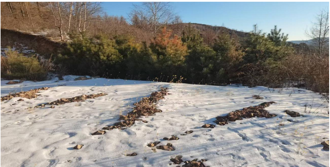
照片 2-15 3#塌陷坑