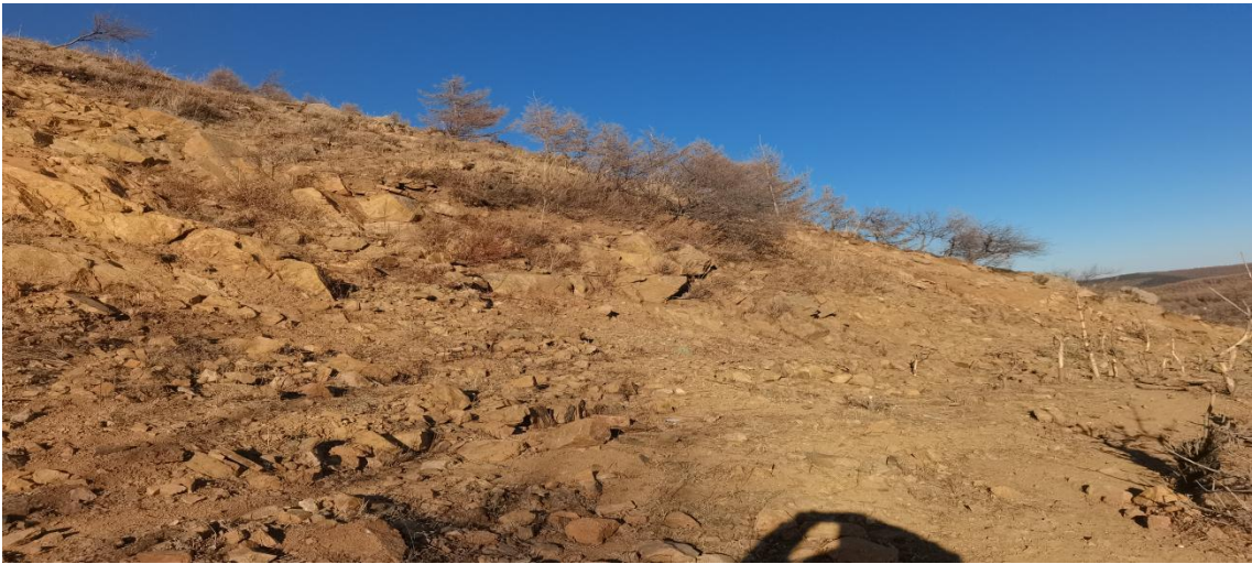
照片 2-17 废弃采坑