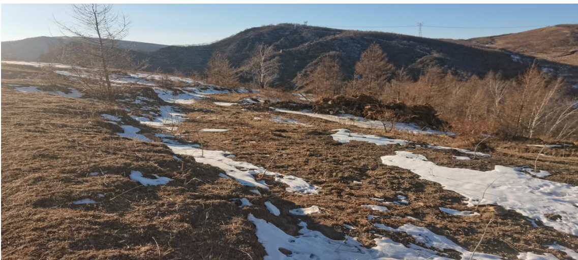
照片 2-18 废弃矿区道路