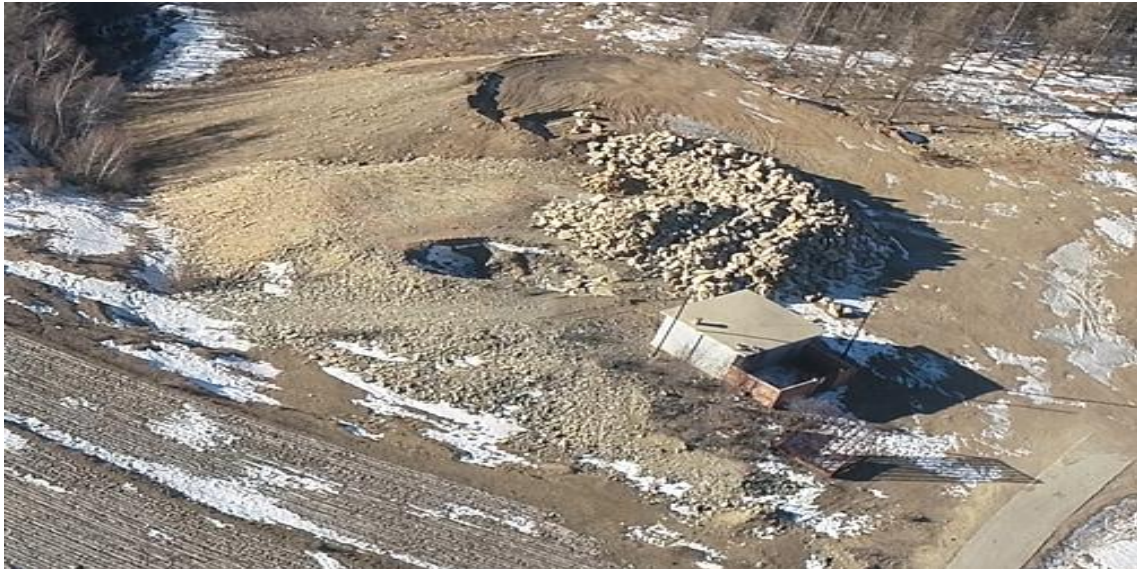
照片 2-5 1#废石场

位于矿区中部平缓地势处，呈扇状松散堆积，堆体占地面积 3400\text{m}^2 ，堆积高度 20\text{m} ，坡面角 37^\circ ，堆积量 2200\text{m}^3 。废石废渣堆积，破坏植被，形成黑灰色堆积地貌，与周边地形地貌景观不相协调，见照片 2-5 1#废石场。