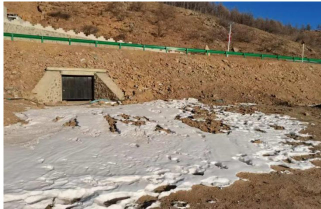
照片 2-3 PD1