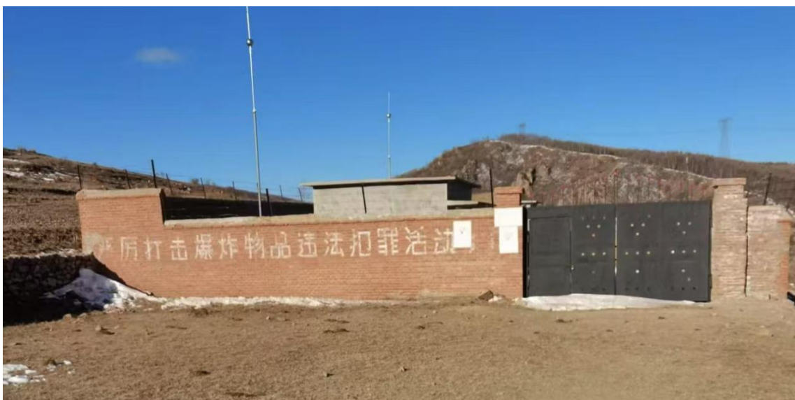
照片 2-6 炸药库

位于 1#废石场南部 70\text{m} 处，处于缓坡处，无人工切坡，占地面积 1685\text{m}^2 ，主要建设了 2 个砖混结构建筑库房，高 2.5\text{m} ，建筑面积 80\text{m}^2 。围墙长 120\text{m} ，高 2.7\text{m} ，宽 0.5\text{m} 。场地建设破坏地表植被，形成与周边地形地貌景观不相协调的生态斑块，见照片 2-6 炸药库。