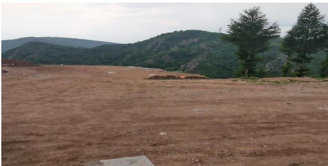
照片 2-9 矿区道路

矿区道路连接办公生活区、竖井 SJ1 工业场地、1#废石场等场地并与乡间道路相接，道路长 495m，宽 4m，占地面积 1980m 2 。此外，在 1#废石场西部遗留两段废弃道路，面积 2345m 2 ，在矿区北东部山坡处遗留两段废弃道路，面积 2000m 2 。以及矿区外未曾治理的路段，面积 3896m 2 。矿区道路总占地面积 10221m 2 。道路两侧未见切坡，路面因运输碾压而硬化，破坏地表植被，形成与周边地形地貌不相协调的生态斑块，见照片 2-9 矿区道路。