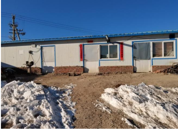
照片 2-1 值班室