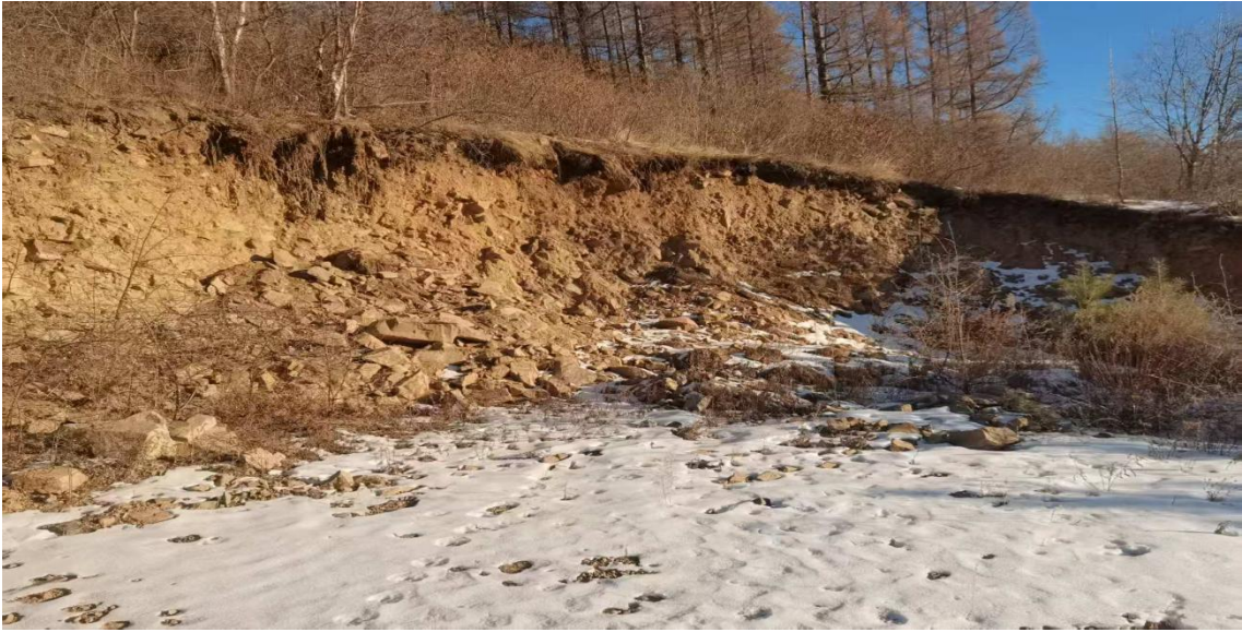
照片 2-16 3#塌陷坑边坡