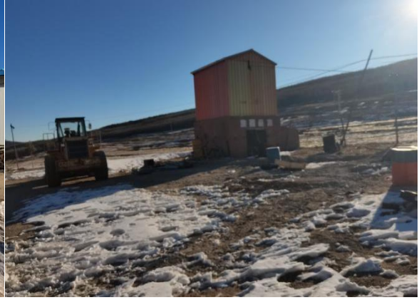
照片 2-2 SJ1