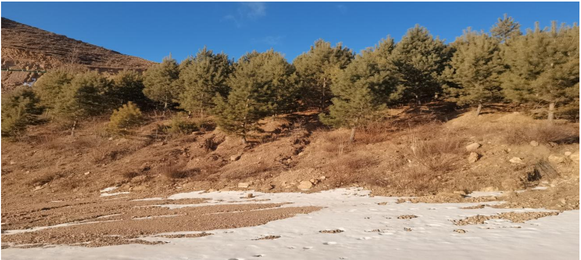
照片 2-14 2#塌陷坑