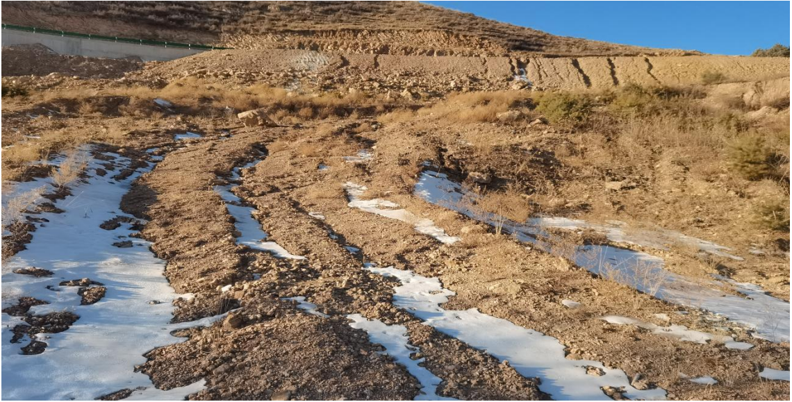
照片 2-13 1#塌陷坑