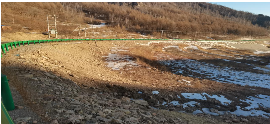
照片 2-12 PD2 工业场地