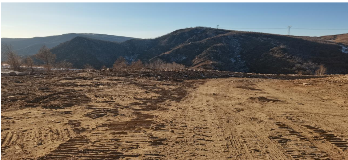
照片 2-10 10#废石场