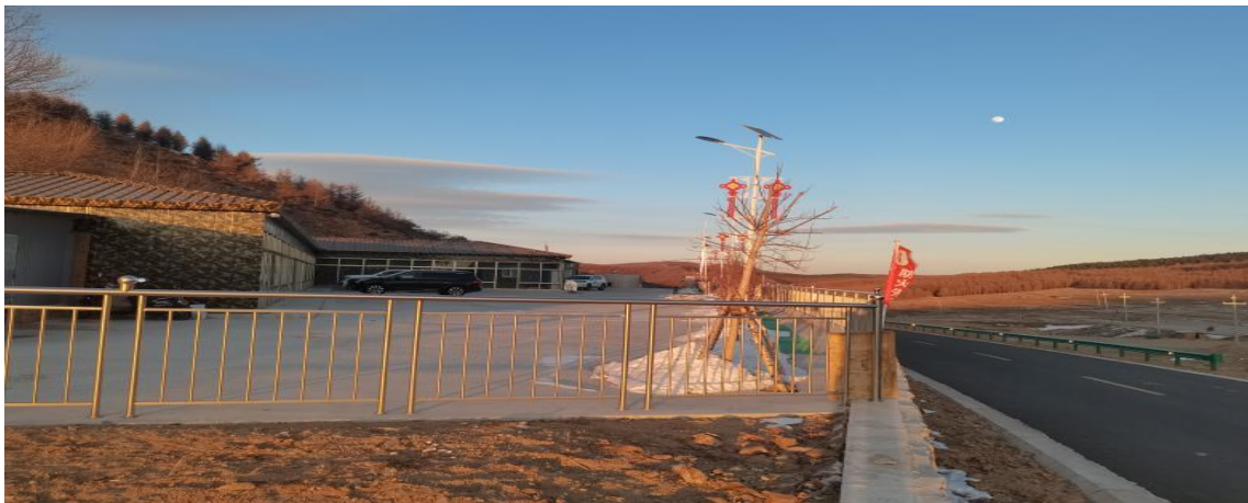
照片 2-4 办公生活区

紧邻竖井 SJ1 工业场地北部,处于山坡底部地势平缓处,依山而建,占地面积 3380m 2 ,已建设办公室、职工宿舍、机电室等砖混结构建筑平房,建筑面积 450m 2 。依山一侧人工切坡高度小于 2m,长 50m,挖方量 125m 3 ,坡面近直立,较规整,开挖的土石排放在办公生活区边部形成规整的堆坡。场地建设破坏地表植被,形成与周边地形地貌景观不相协调的生态斑块,见照片 2-4 办公生活区。