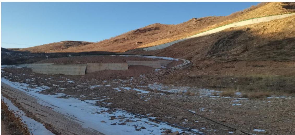
照片 2-11 11#废石场